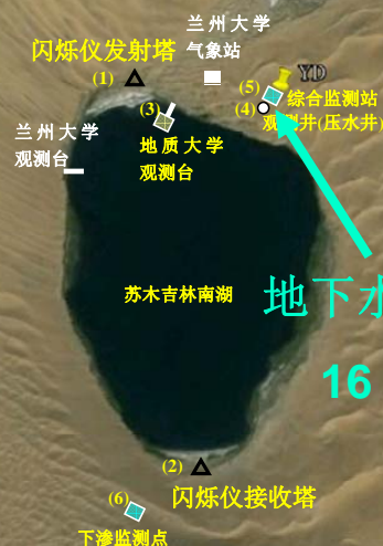
地下水监测孔 16 m 深